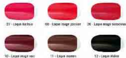
07 - Laque fuchsia

Une palette de 6 teintes laquées ultra-brillantes